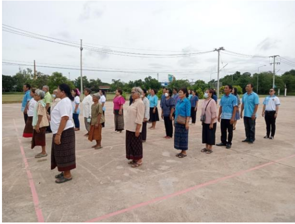
ครั้งที่ 5 วันที่ 25 สิงหาคม 2566