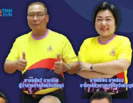
นายอรรถวิทย์ ชาตนิมิต ผู้อำนวยการจังหวัดชัยภูมิ

วันเสาร์ที่ 2 พฤศจิกายน 2567 เวลา 05.00 น. ณ ศาลากลางจังหวัดชัยภูมิ