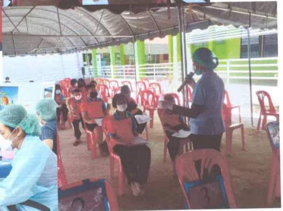
พานักเรียนรับวัคซีนป้องกันโรคติดเชื้อไวรัสโคโรนา 2019 (COVID-19) ที่โรงพยาบาลบ้านเขว้า อ.บ้านเขว้า จ.ชัยภูมิ