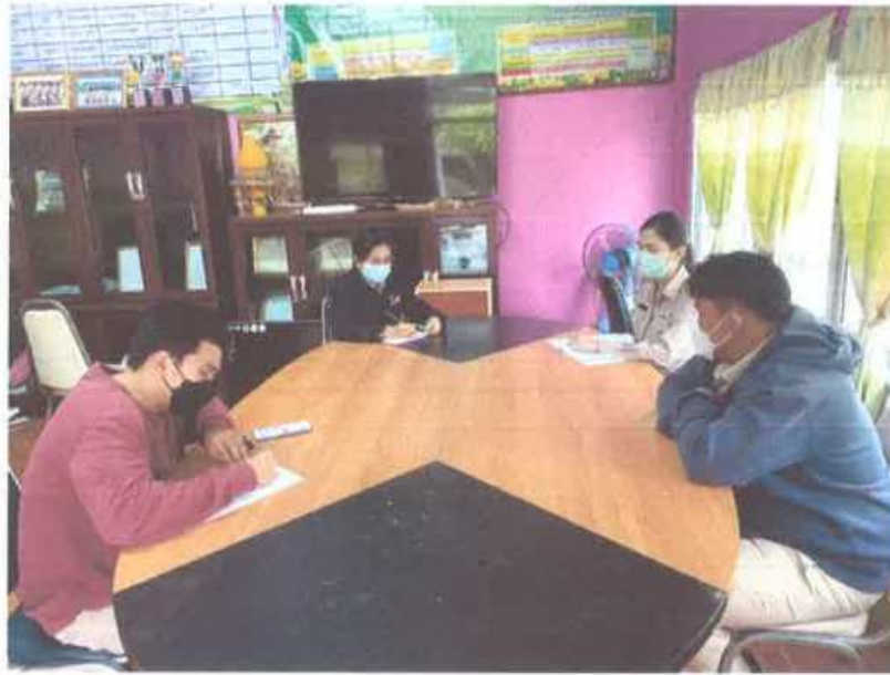
คณะครูร่วมประชุมวางแผน การดำเนินงานโครงการ